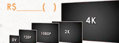
Foto Entrega Rápida

Substitui a gravação Full HD (1920x1080), para a gravação em 4k (3840x2160)